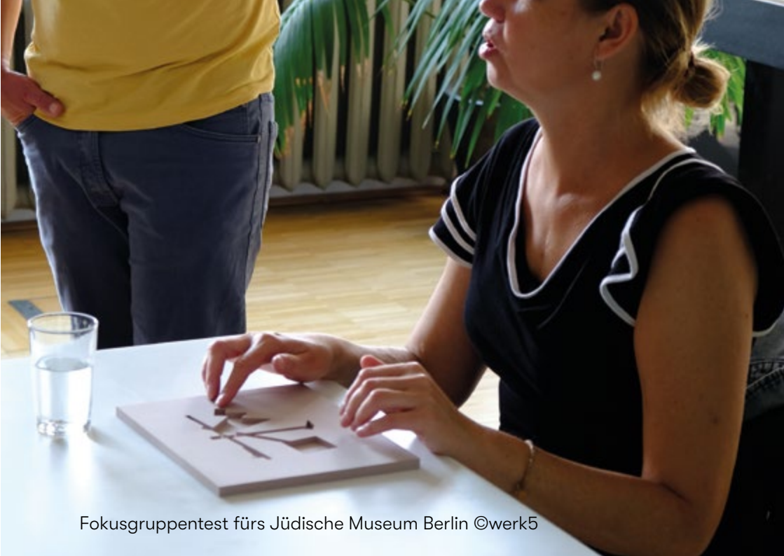
Fokusgruppentest fürs Jüdische Museum Berlin