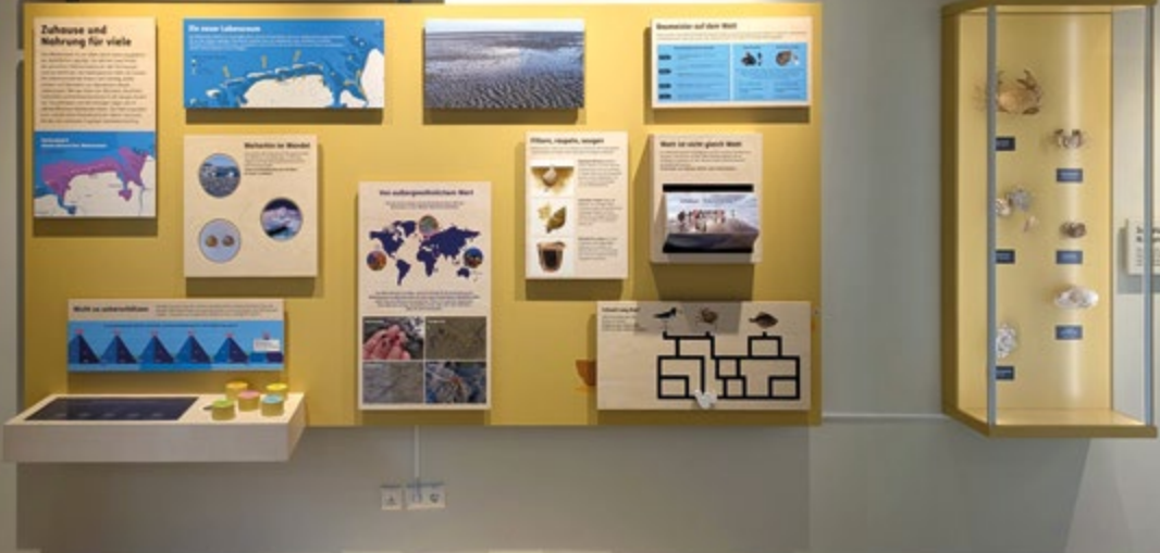
Nationalpark-Haus „Wattenhuus“, Benersiel