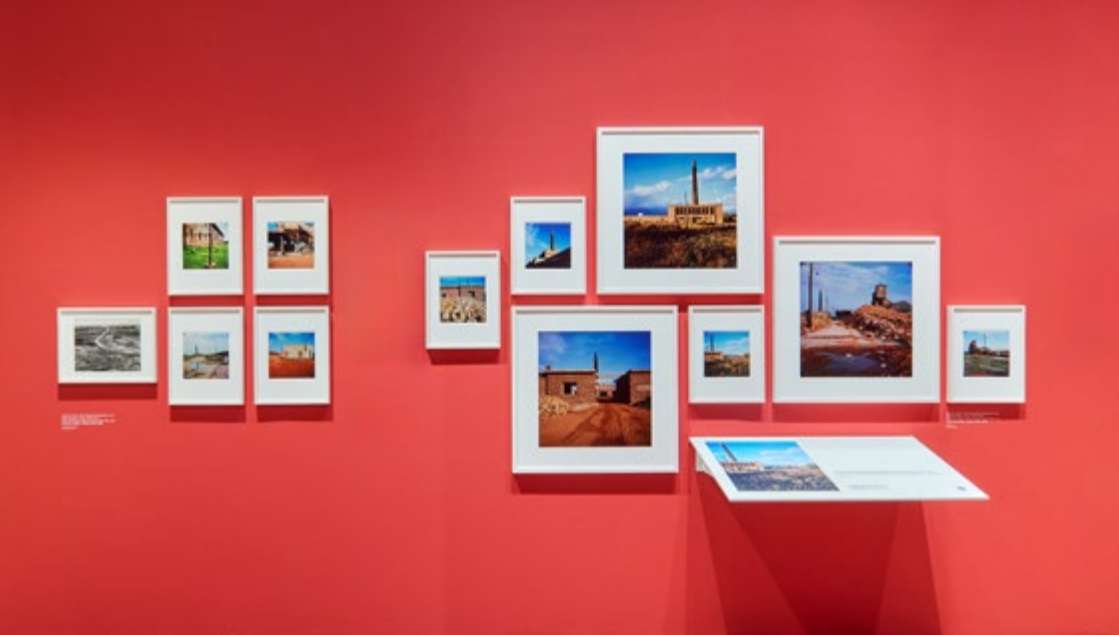
Wien Museum, Wien © Lisa Rastl