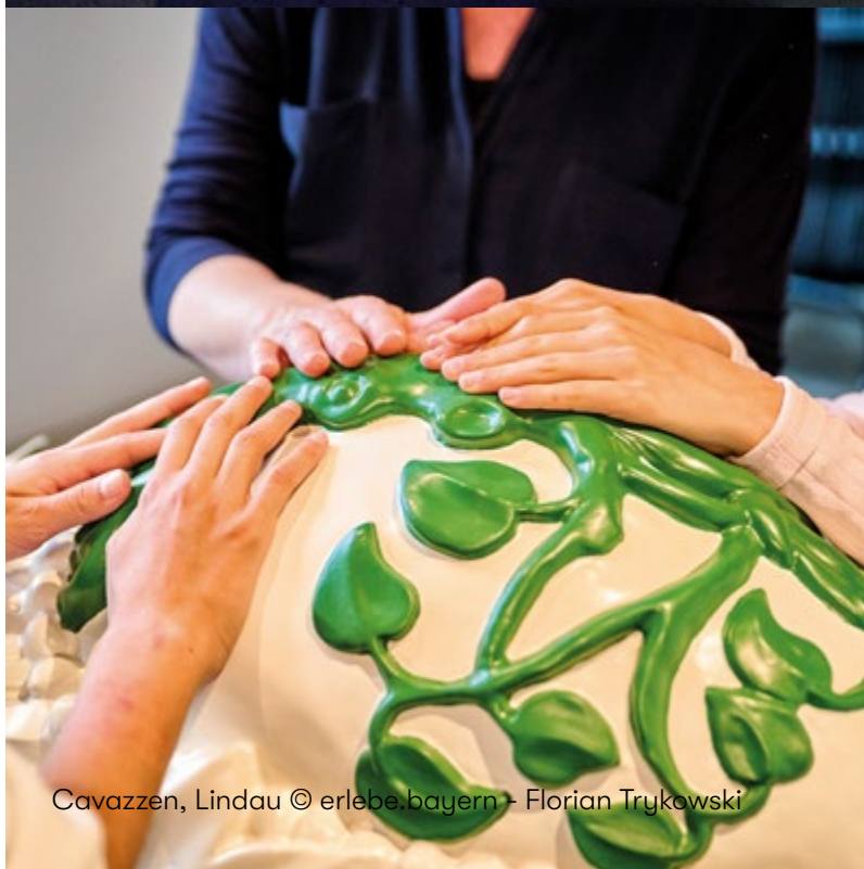
Cavazzen, Lindau