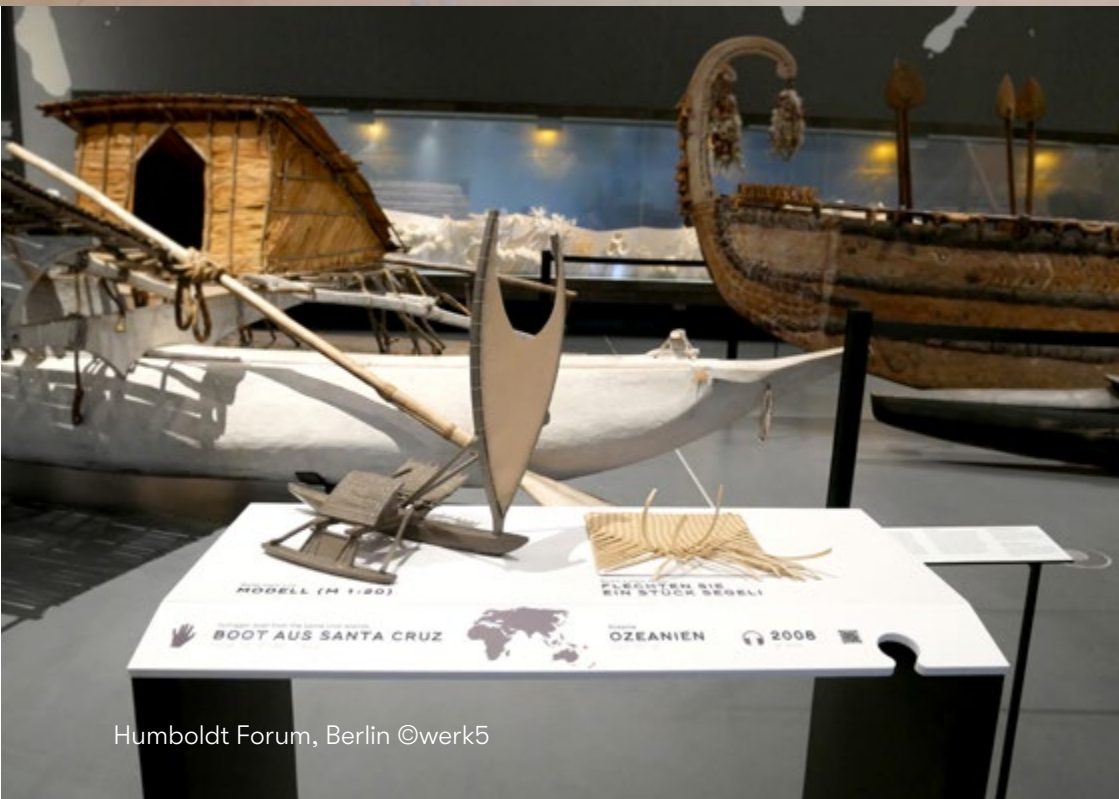
Humboldt Forum, Berlin