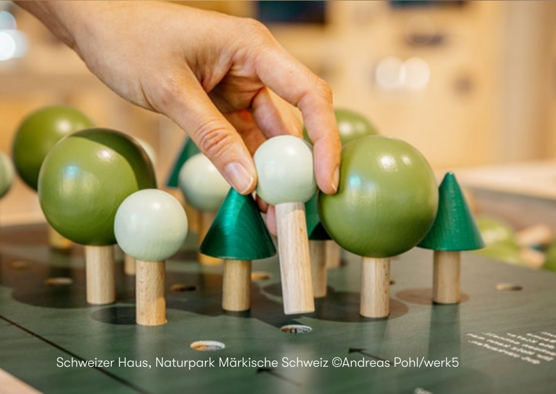
Schweizer Haus, Naturpark Märkische Schweiz