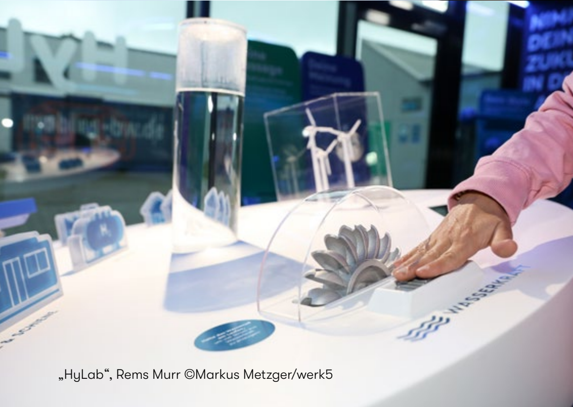
„HyLab“, Rems Murr